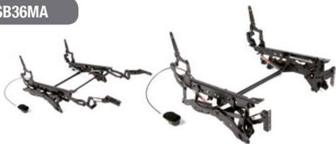
Mecanismo SB36MA Manual