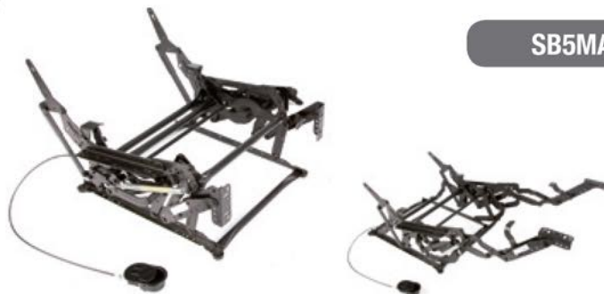
Mecanismo SB5MA Manual