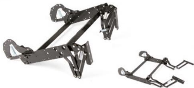
Mecanismo SB52MA - Empujón Empurrão