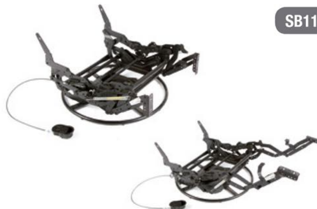
Mecanismo SB11MA Giratorio y Balancín Giratório e Balancim